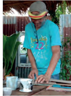
Malen und Töpfern Khun Nong